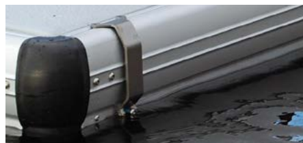
Anneau d'amarrage en inox