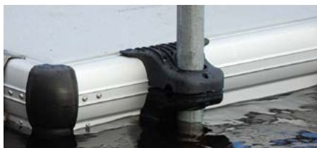
Support pour pieux