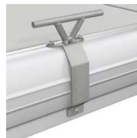
Taquet d'amarrage en inox