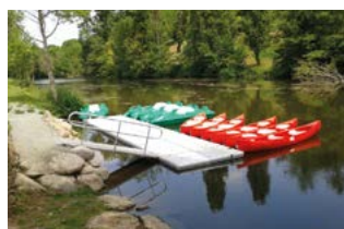
Passerelle en aluminium