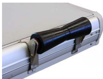
Rouleau de mise à l'eau