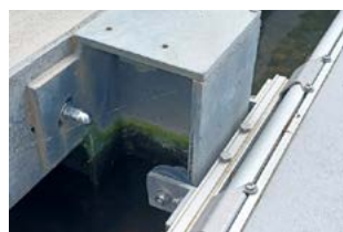
Étrier en aluminium pour poutrelle HEB