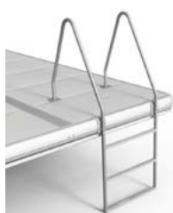
Echelle de bain

Le profilé en aluminium en C sur le pourtour de chaque section de ponton permet l'adaptation de toute une série d'accessoires, standards comme ceux que nous vous proposons ici (pare-battage, anneau d'amarrage, échelle de bain, etc.) ou sur mesure, réalisés par nos soins ou les vôtres.